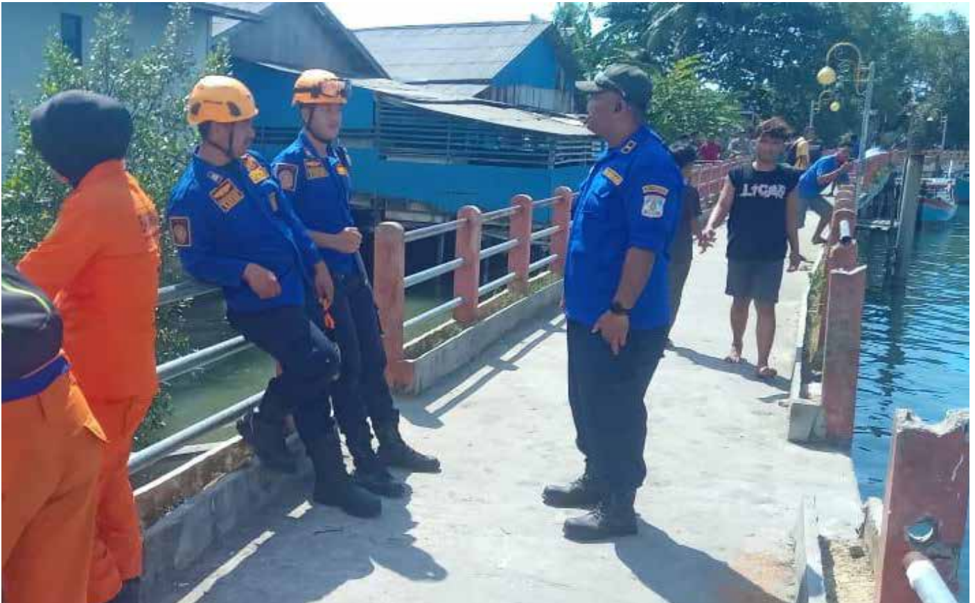
Tim SAR gabungan berada di lokasi kejadian di Sungai Pantai Manggar, Balikpapan Timur.