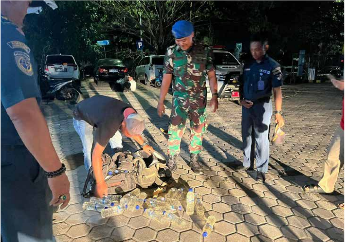
Pengamanan Tas Berisi miras di Pelabuhan Loktuan.