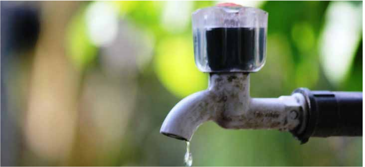
Ilustrasi Krisis Air (Kompas.com)