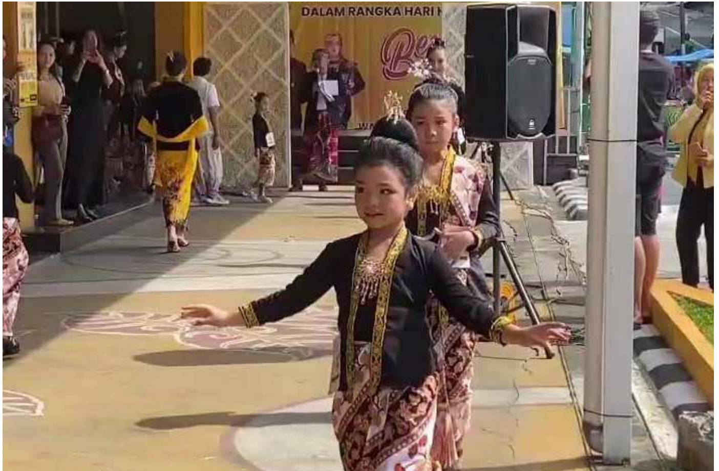
Salah satu peserta fashion show dalam memperingati Hari Kartini, 21 April.