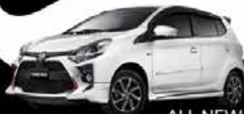
ALL NEW AGYA