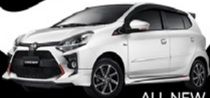
ALL NEW AGYA