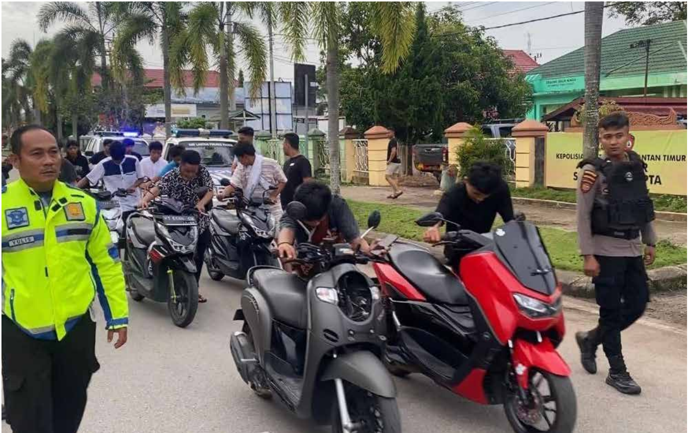
Personel Polres Paser saat membubarkan balap liar