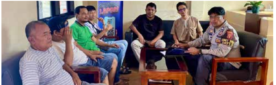
Anggota ATB saat mengajukan gugatan hukum ke Polres Bontang.

"Semua itu sudah ditentukan, untuk menjaga persaingan bisnis tidak boleh lebih mahal ataupun lebih murah," katanya.