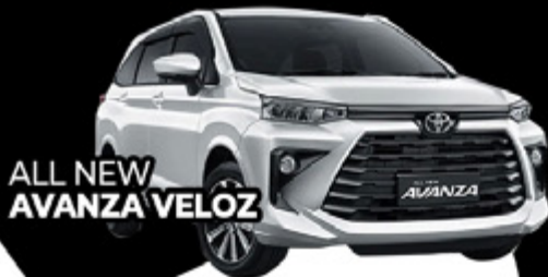
ALL NEW AVANZA VELOZ