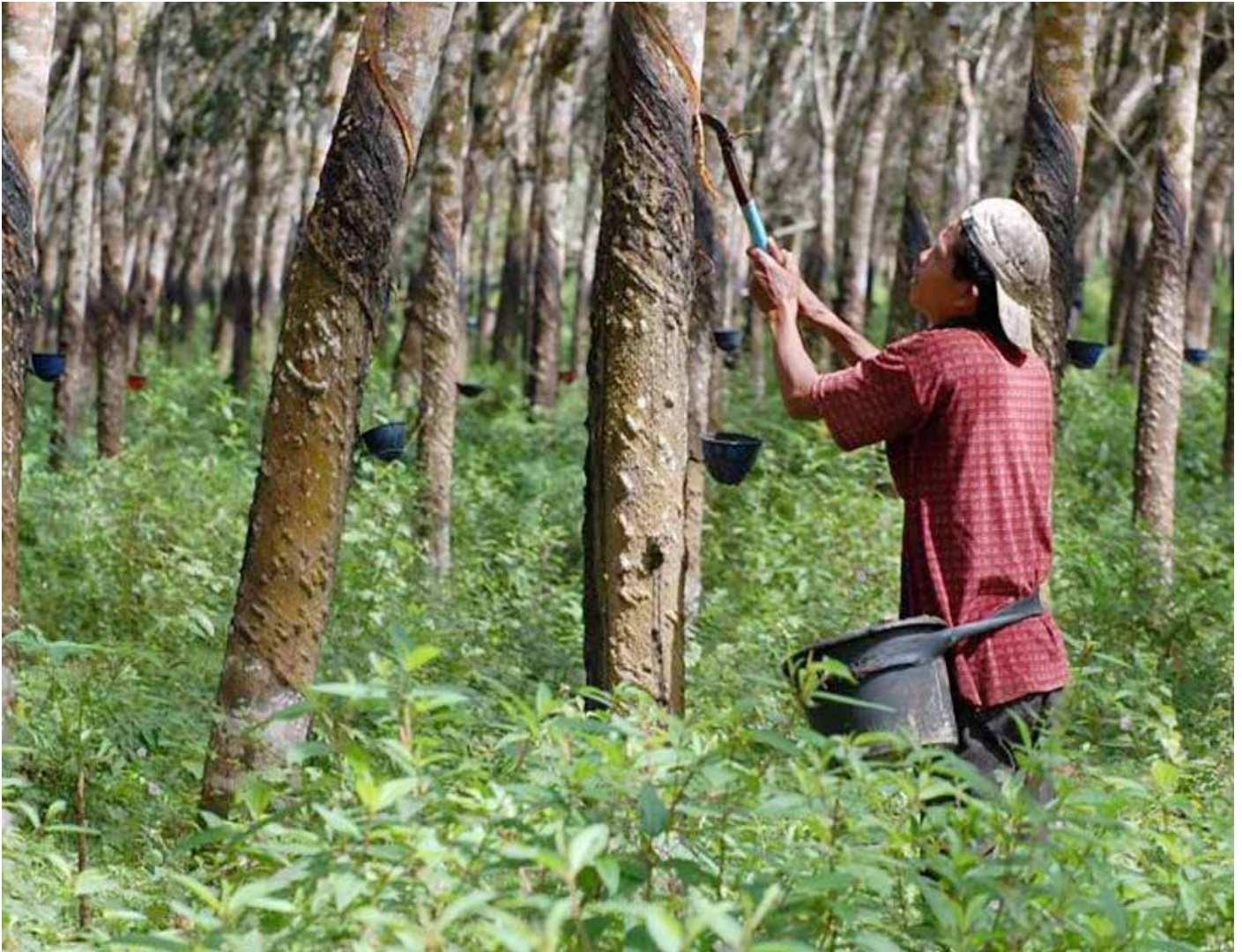
Ilustrasi perkebunan kelapa sawit. (Istimewa)