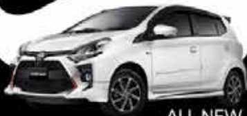
ALL NEW AGYA