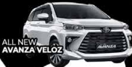
ALL NEW AVANZA VELOZ