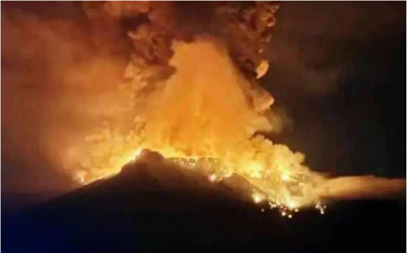
Gunung Ruang Saat Meletus