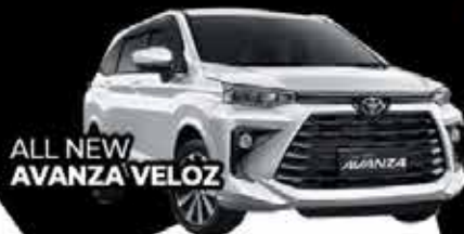
ALL NEW AVANZA VELOZ