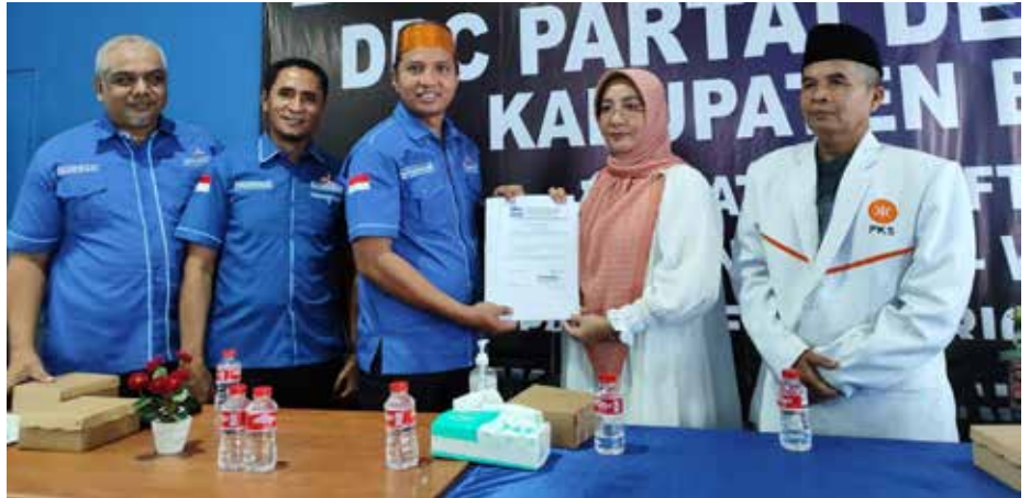
DPD PKS Berau serahkan Formulir ke DPC Demokrat di Kantor DPC Demokrat.

"Kami telah bersilaturahmi dengan Partai PPP, Hanura, Golkar, PKB dan Perindo. Namun, kami telah memiliki calon Bupati. Jika ada yang mengajukan Bakal Calon Wakil Bupati tidak