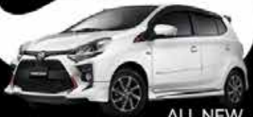
ALL NEW AGYA