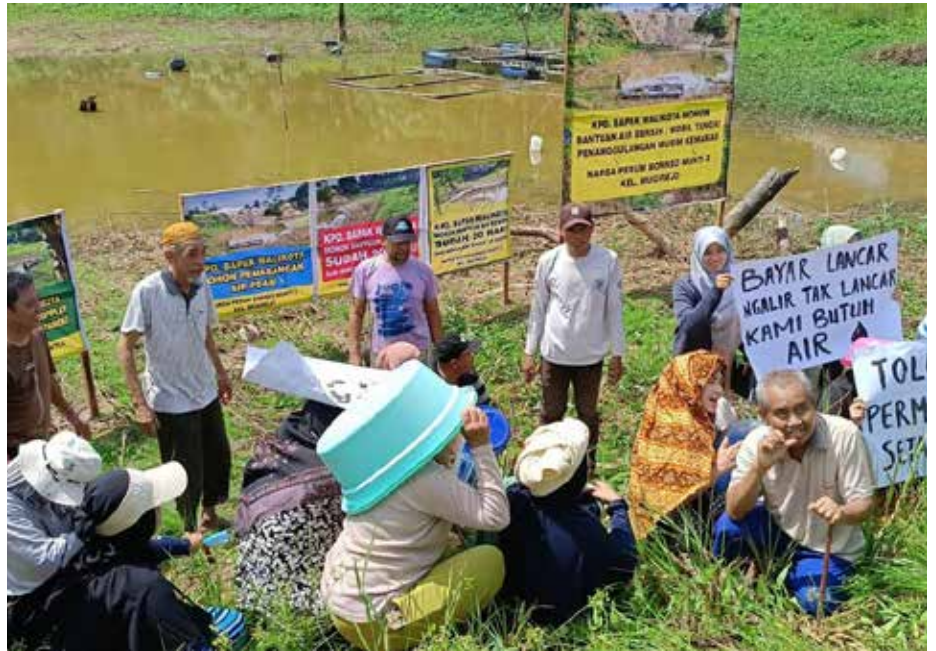
Warga Perumahan Borneo Mukti 2, Kelurahan Mugirejo, Kota Samarinda yang didominasi ibu-ibu berunjukrasa di sekitar danau yang sudah mengering. Danau ini selama ini menjadi sumber bahan baku air bersih di perumahan tersebut.

Sedangkan opsi kedua yang bisa menjadi alternatif sementara, yaitu Wali Kota diharapkan meminta