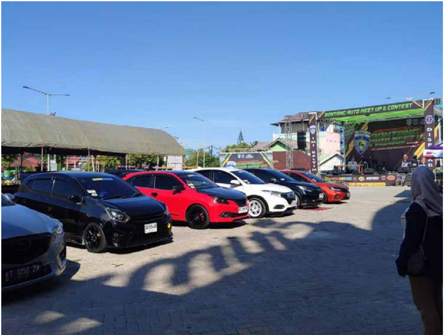
Bontang Auto Meet Up and Contest 2024 di Halaman Parkir Citimall Bontang.