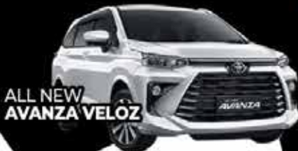
ALL NEW AVANZA VELOZ