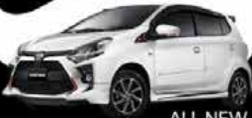
ALL NEW AGYA