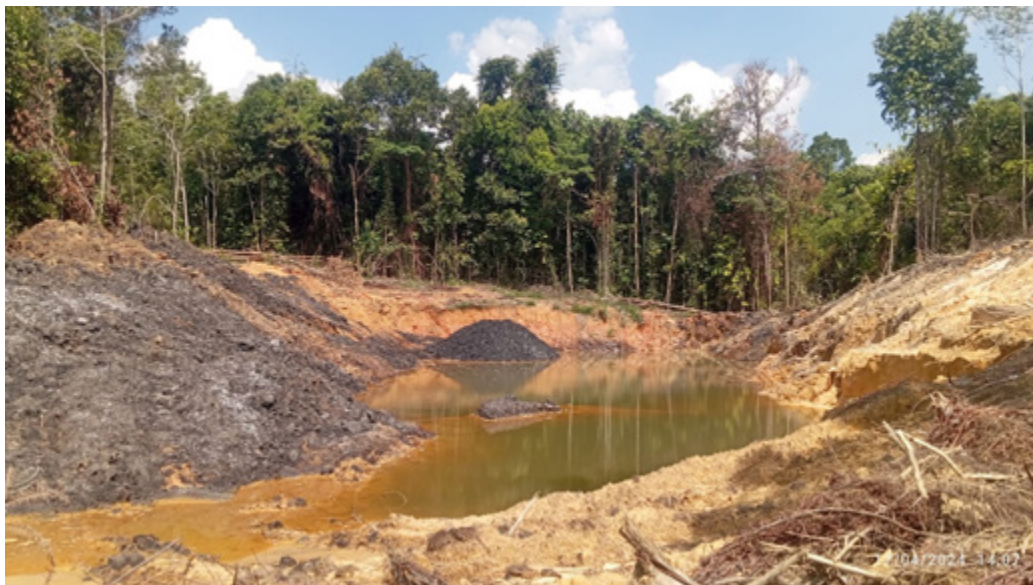
Penumpukan batu bara (Koridoran) illegal di Kampung Intu Lingau Kecamatan Nyuatan. Foto diambil pada Rabu,(17/4/2024).