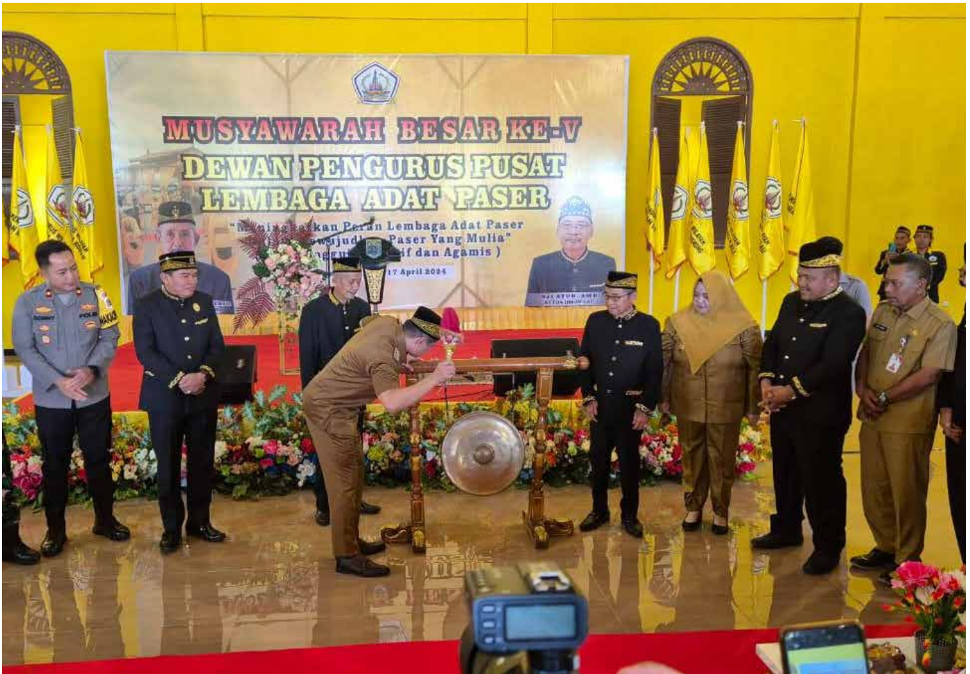
Mubes ke V DPP LAP