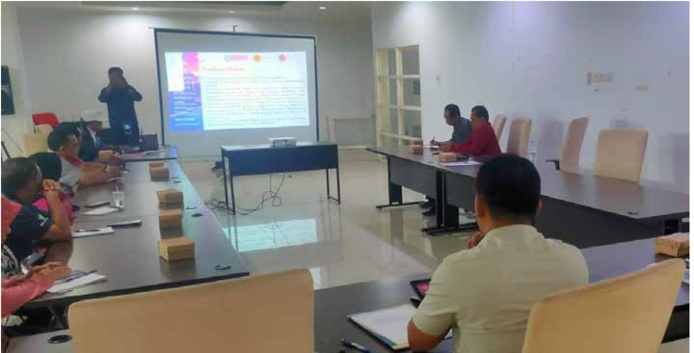
Persiapan lomba Desa Berprestasi di Kantor DPMD Kabupaten Paser