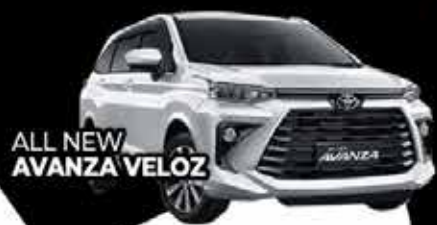
ALL NEW AVANZA VELOZ