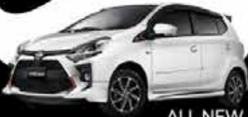
ALL NEW AGYA