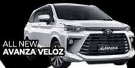
ALL NEW AVANZA VELOZ