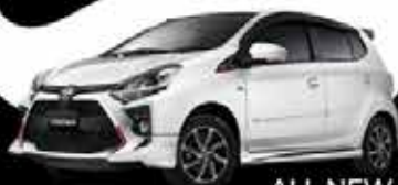
ALL NEW AGYA