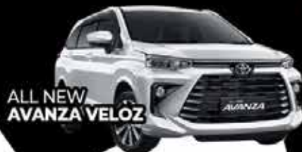
ALL NEW AVANZA VELOZ