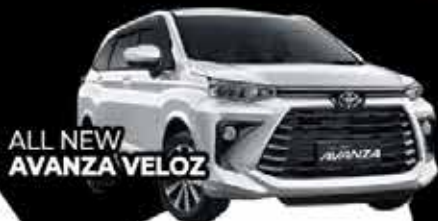
ALL NEW AVANZA VELOZ