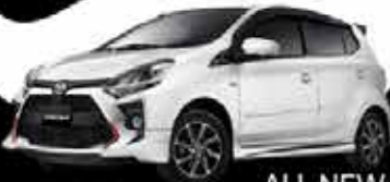
ALL NEW AGYA