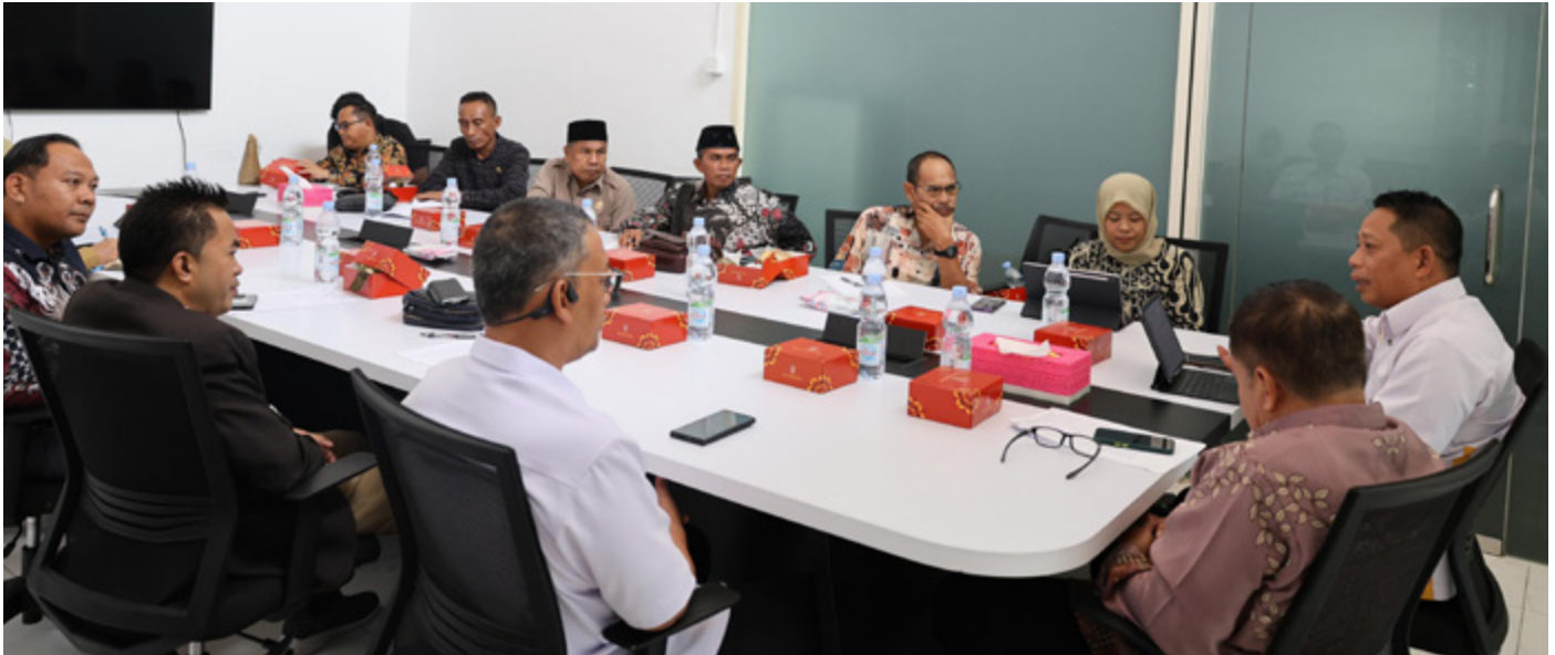
Rapat koordinasi yang diadakan oleh Otorita IKN bersama DPRD Kabupaten Kutai Kartanegara (Kukar) di Kantor Otorita IKN, Balikpapan, pada hari Senin (22/04/2024).