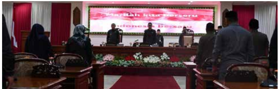
Rapat paripurna DPRD Kabupaten Paser di Gedung Baling Seleloi

Terkait pemenuhan mandatory spending sebesar 20 persen pada