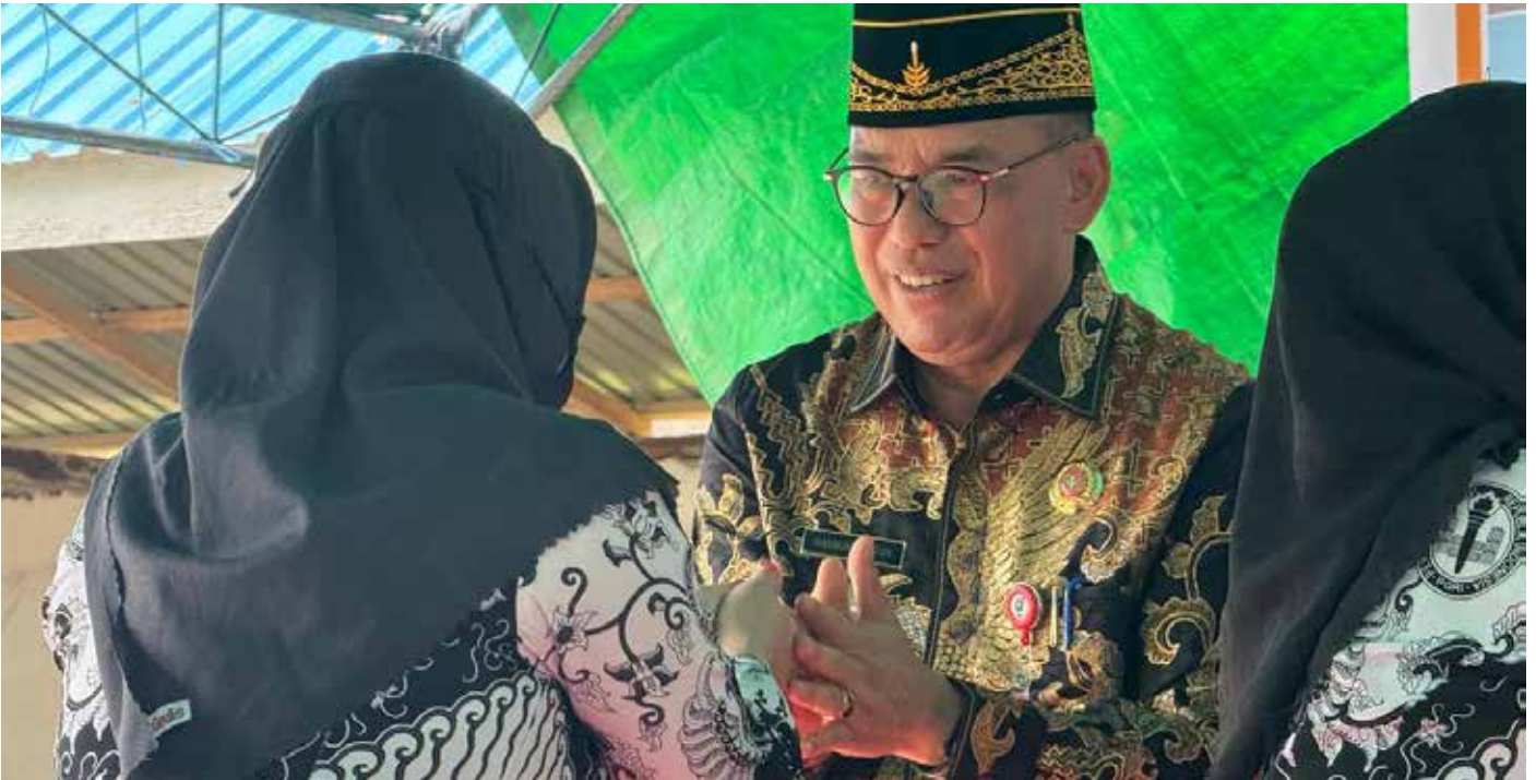
Pj Bupati PPU Makmur Marbun saat menghadiri kegiatan Silaturahmi Syawal Persatuan Guru Republik Indonesia (PGRI) se-Kecamatan Sepaku di Desa Wonosari, Kecamatan Sepaku, Senin(22/4/2024).