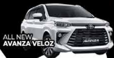
ALL NEW AVANZA VELOZ