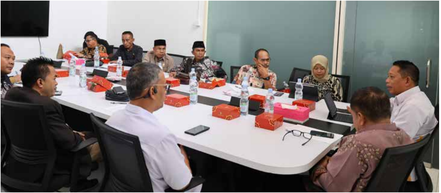
Rapat koordinasi yang diadakan oleh Otorita IKN bersama DPRD Kabupaten Kutai Kartanegara (Kukar) di Kantor Otorita IKN, Balikpapan, pada hari Senin (22/04/2024).