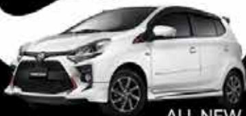
ALL NEW AGYA