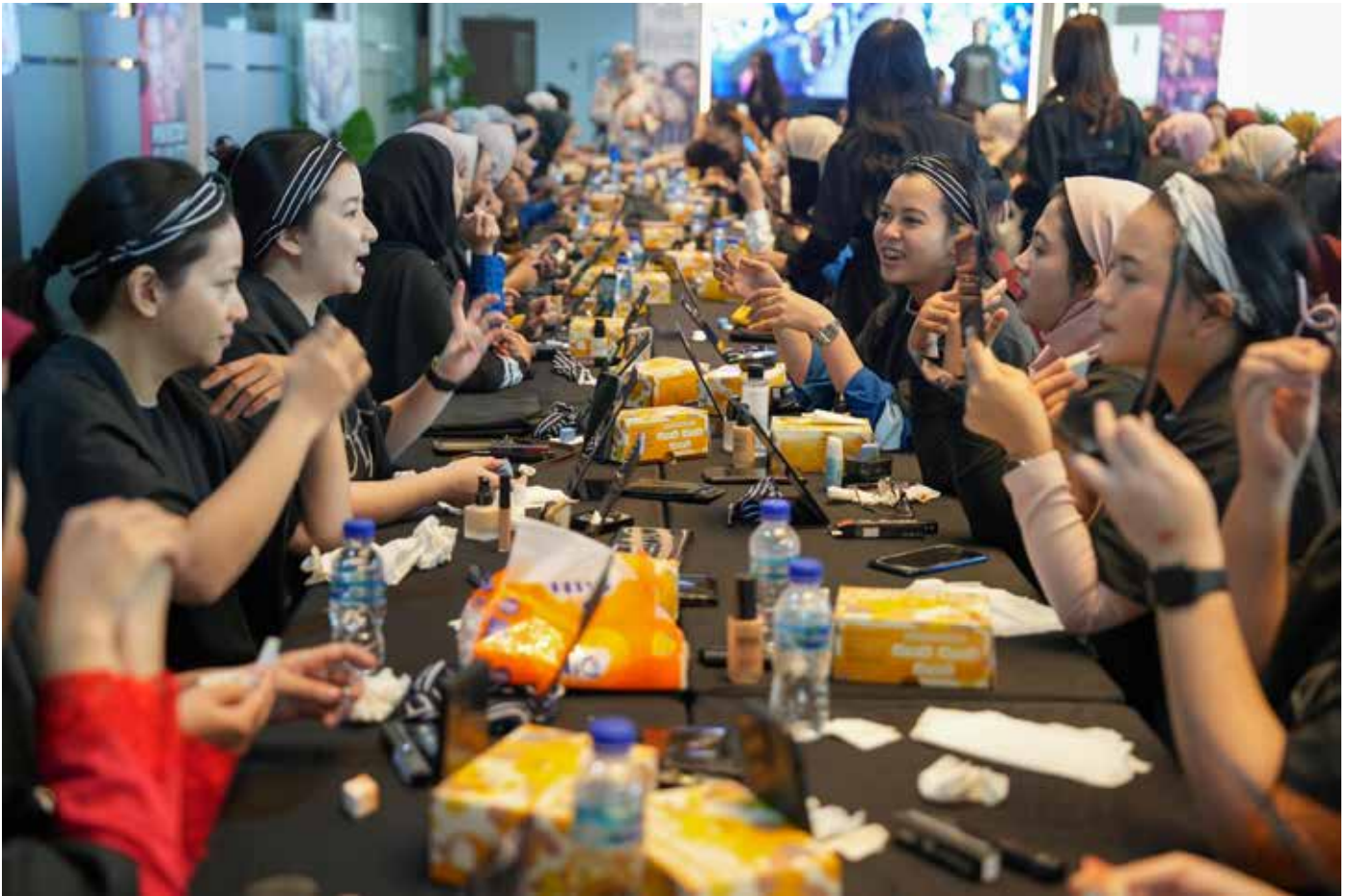
Sejumlah pekerja wanita dan istri pekerja KPB mengikuti Beauty Class x Make Over.