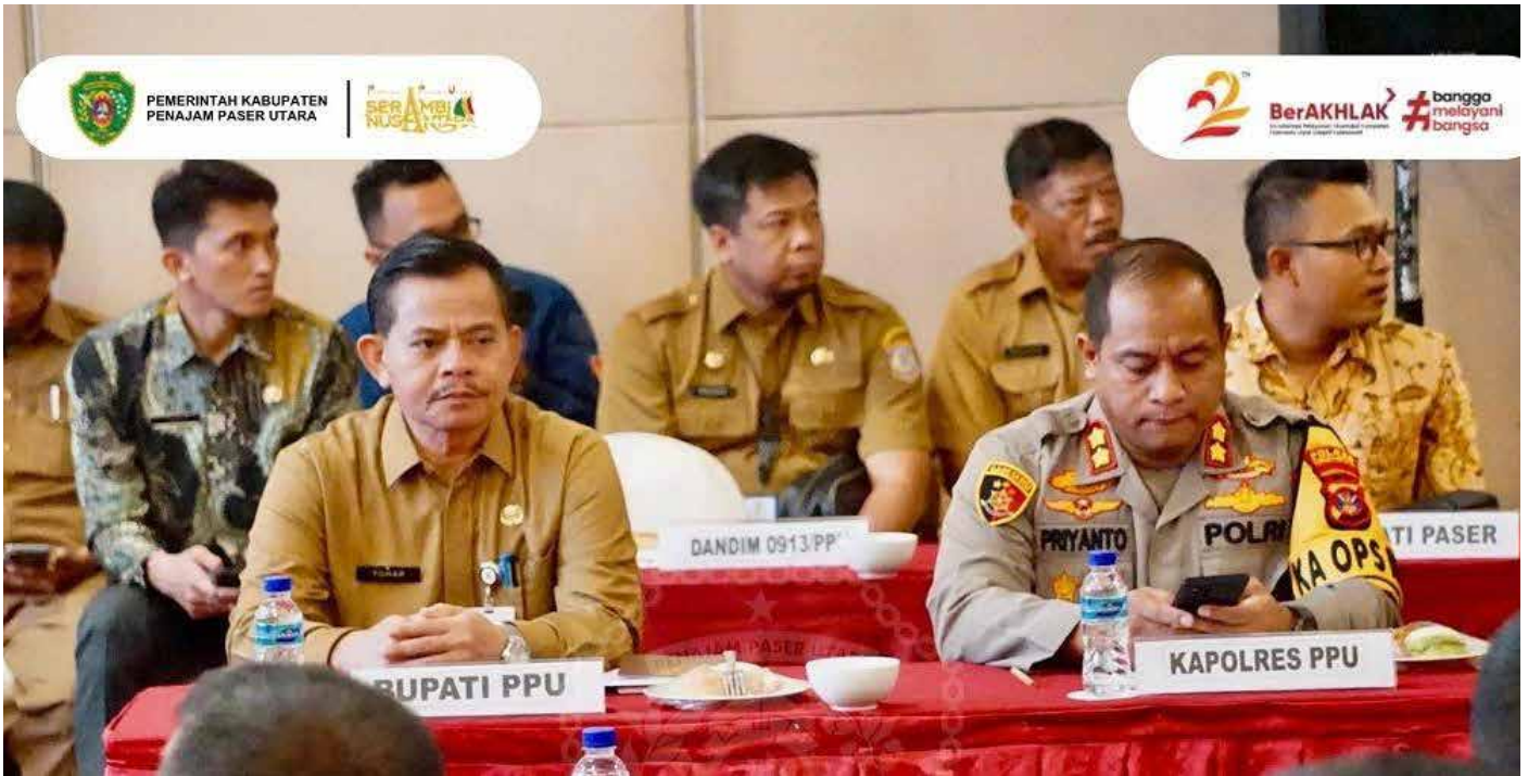
Sekcab PPU, Tohar dalam rapat koordinasi terakhir dalam mempersiapkan kegiatan Latsitarda Nusantara XLIV 2024 di Platinum Hotel Balikpapan, Senin (22/4/2024).