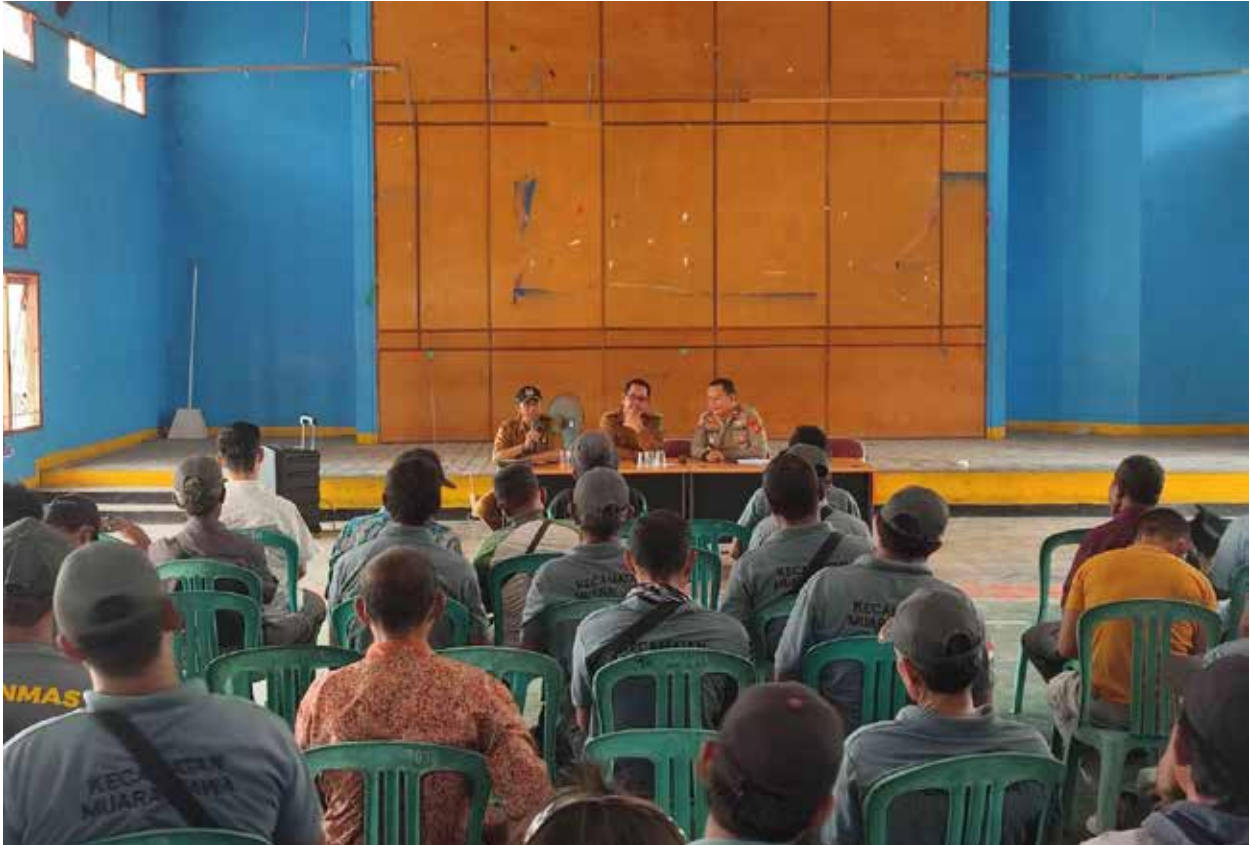
Suasana Rapat dan Pengarahan kepada anggota Linmas di Kecamatan Muara Jawa. (Istimewa)