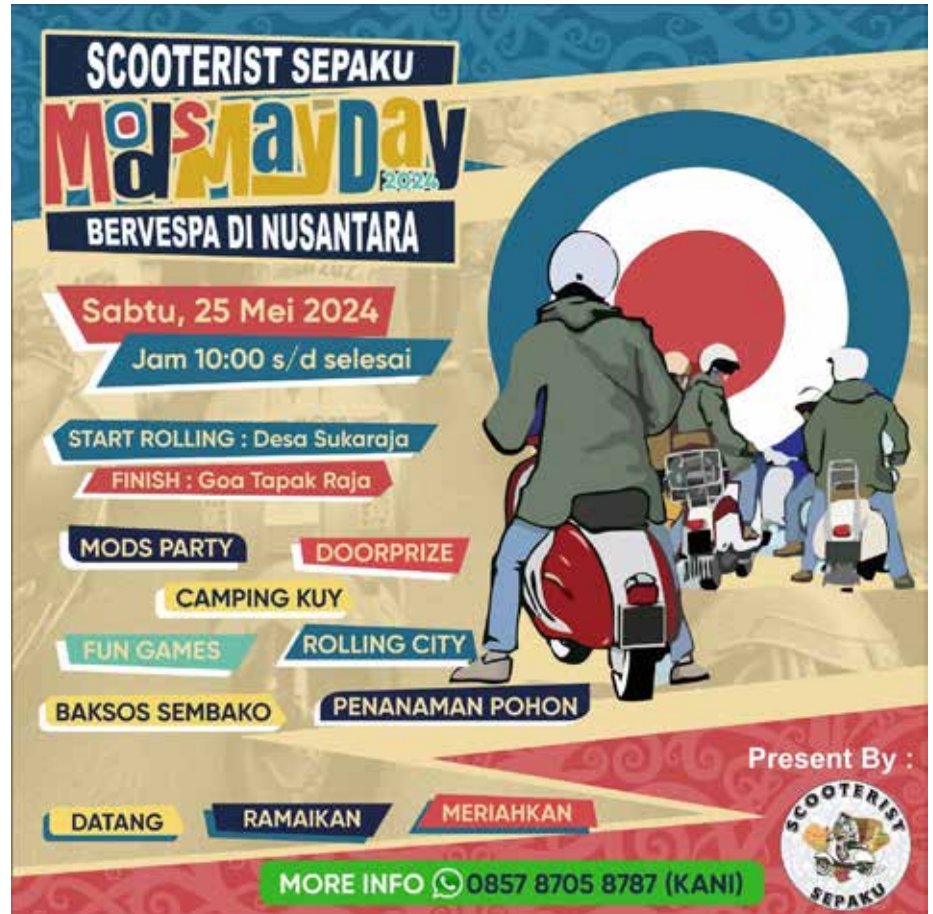
Flyer Sepaku Mods Mayday 2024 “Bervespa di Nusantara”. (Scooterist Sepaku for MKN)

Diperkirakan akan ada sekitar 400 riders yang akan ambil bagian dalam kegiatan ini. Tak hanya itu, penyelenggara juga