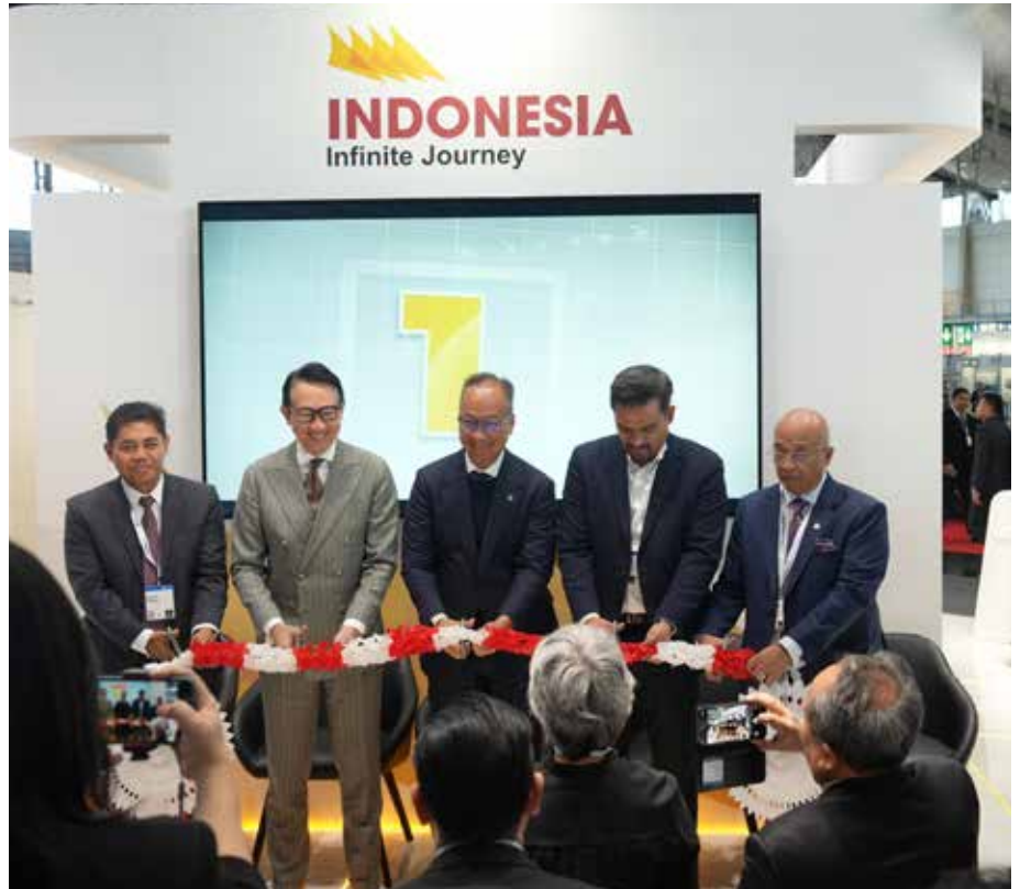
: Otorita Ibu Kota Nusantara (IKN) berpartisipasi dalam pameran perdagangan dan industri Hannover Messe di Kota Hannover, Jerman, pada 22-25 April 2024.

“Seperti kita ketahui IKN memiliki konsep sebagai Smart Sustainable Forest City di mana kita akan membangun kota