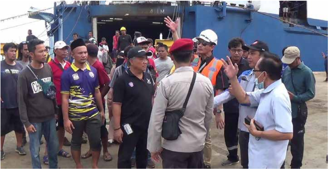
Ribuan penumpang KM Mutiara Ferindo VI yang emosi karena pelayanan buruk di atas kapal.