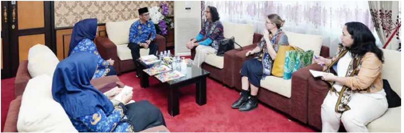
SIGAB Indonesia Kota Balikpapan bersama Duta Besar Australia untuk Indonesia, Gita Kamath saat berfoto bersama di kantor Pemkot Balikpapan, Kamis (25/4).