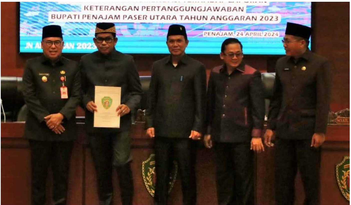
Pj Bupati PPU Makmur Marbun bersama dengan unsur pimpinan DPRD PPU usai Rapat Paripurna Penyampaian LKPJ TA 2023, Rabu (24/4/2024).