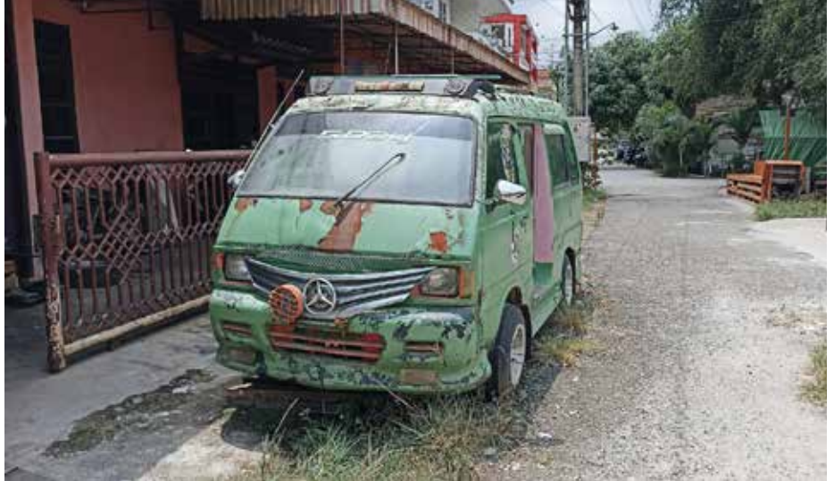
Angkutan Kota yang terbelongkang di sekitaran Terminal Sungai Kunjang

Yusuf bersama 2 orang lainnya merasa tidak puas dengan kepemimpinan Andi Harun. Sebab nasib mereka masih terlanjar, tidak jelas pendapatannya. Mereka tidak melihat Pemerintah Kota memedulikan penurunan pendapatan, sedangkan angkutan kota Samarinda sudah pernah mewarnai transportasi umum kota.