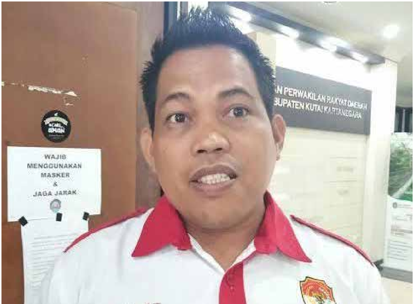
Kepala Desa (Kades), Batuah.