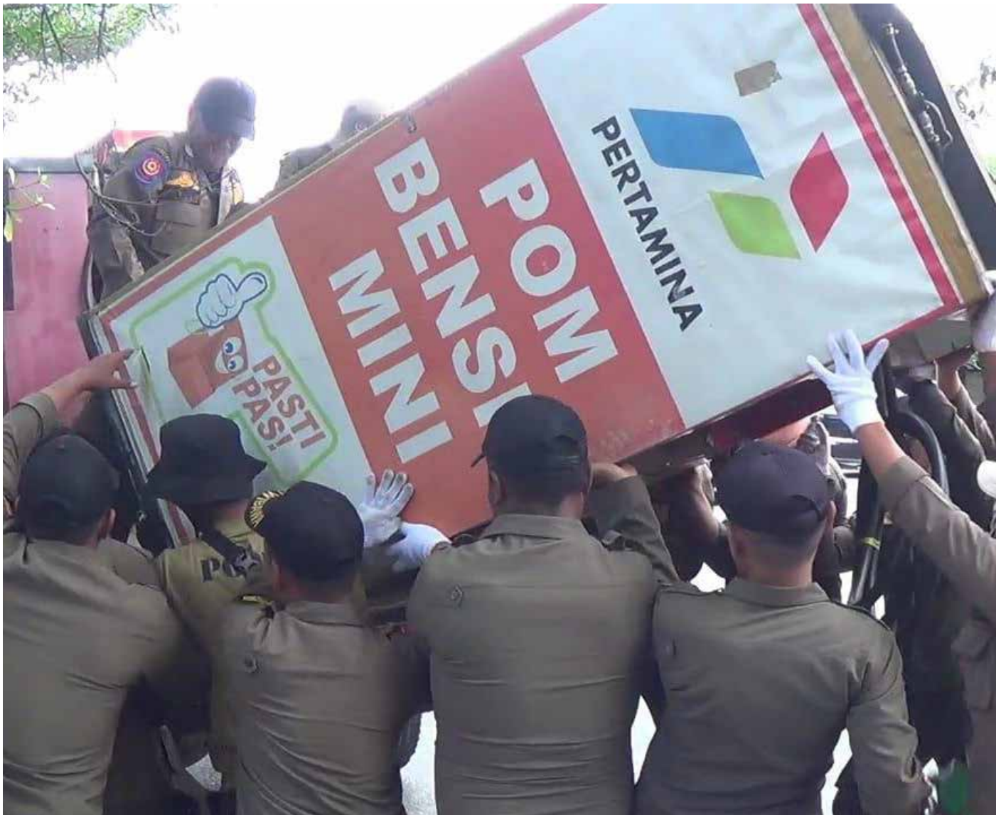
Satpol PP Balikpapan saat menyita Pom Mini dari salah seorang pedagang.