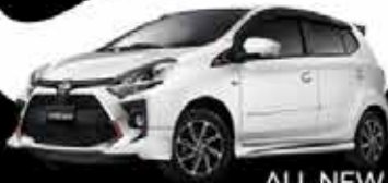
ALL NEW AGYA