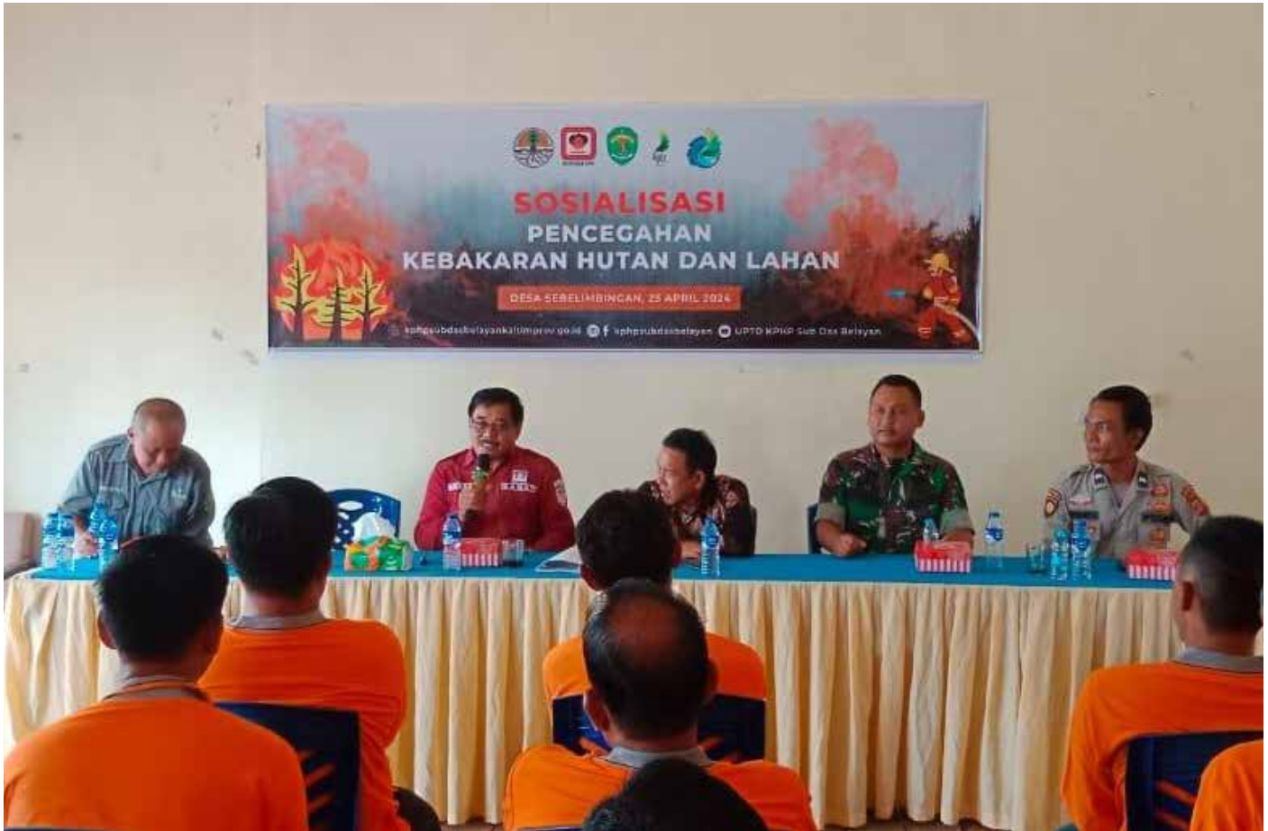
Suasana sosialisasi pencegahan karhutla di Desa Sebelimbingan.