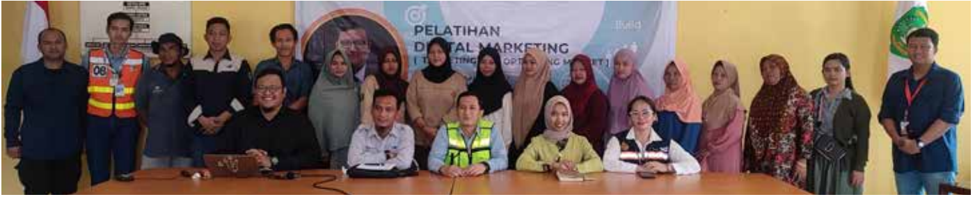
Kegiatan pelatihan digital marketing PAMA dan IMM.