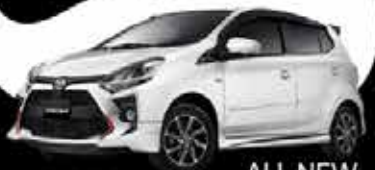
ALL NEW AGYA