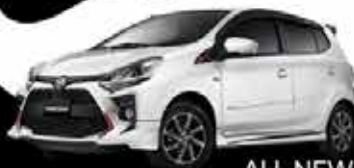
ALL NEW AGYA