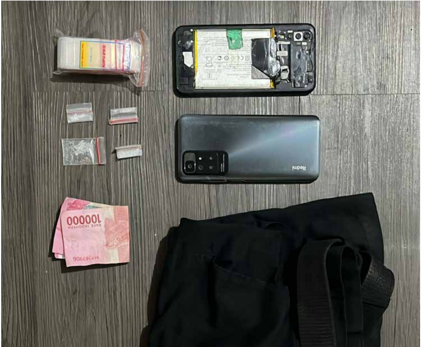
Barang bukti yang diamankan di Mapolres Bontang.