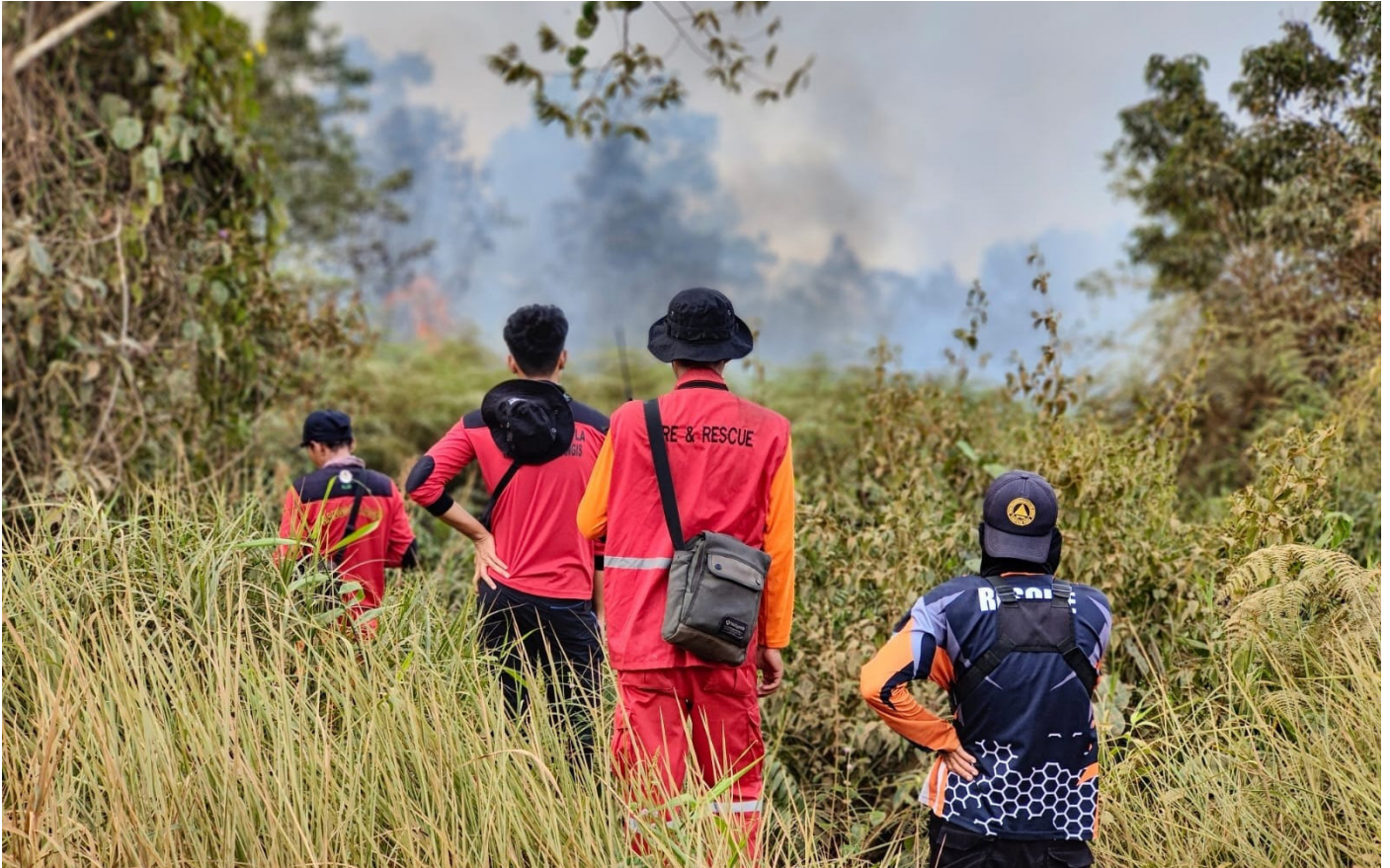
Kebakaran hutan dan lahan di Paser (dokumen)