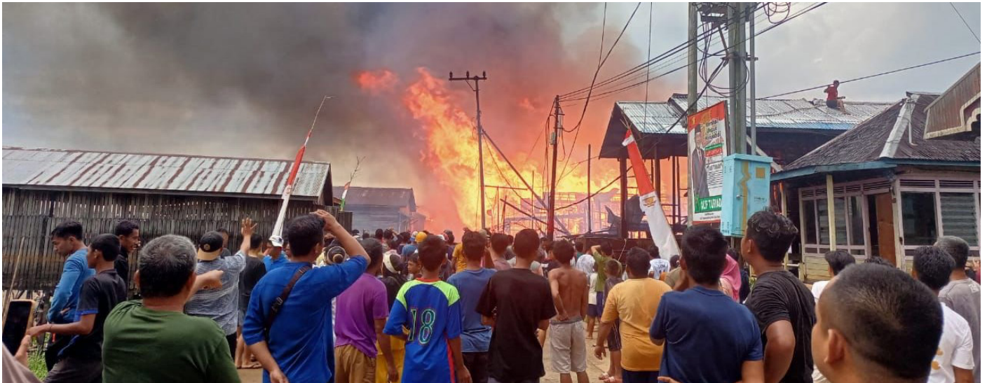
Ilustrasi proses pemadaman kebakaran