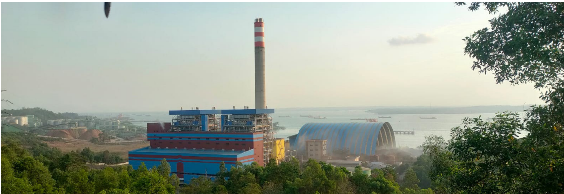
PLTU PT PLN Nusantara Power Unit Pembangkitan Kaltim Teluk, Balikpapan.