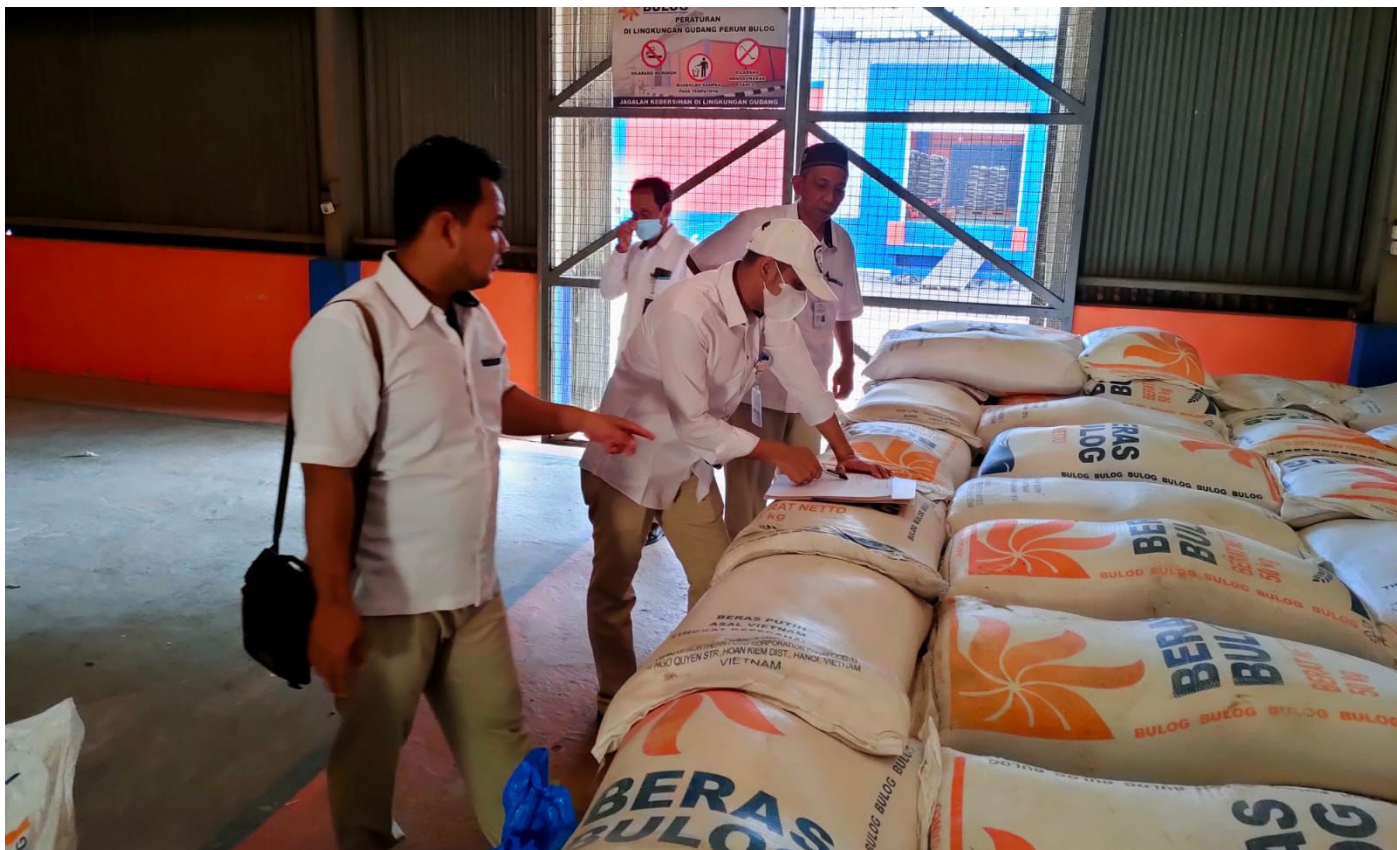
Stok beras di Bulog Berau sebanyak 300 ton hingga awal tahun depan.