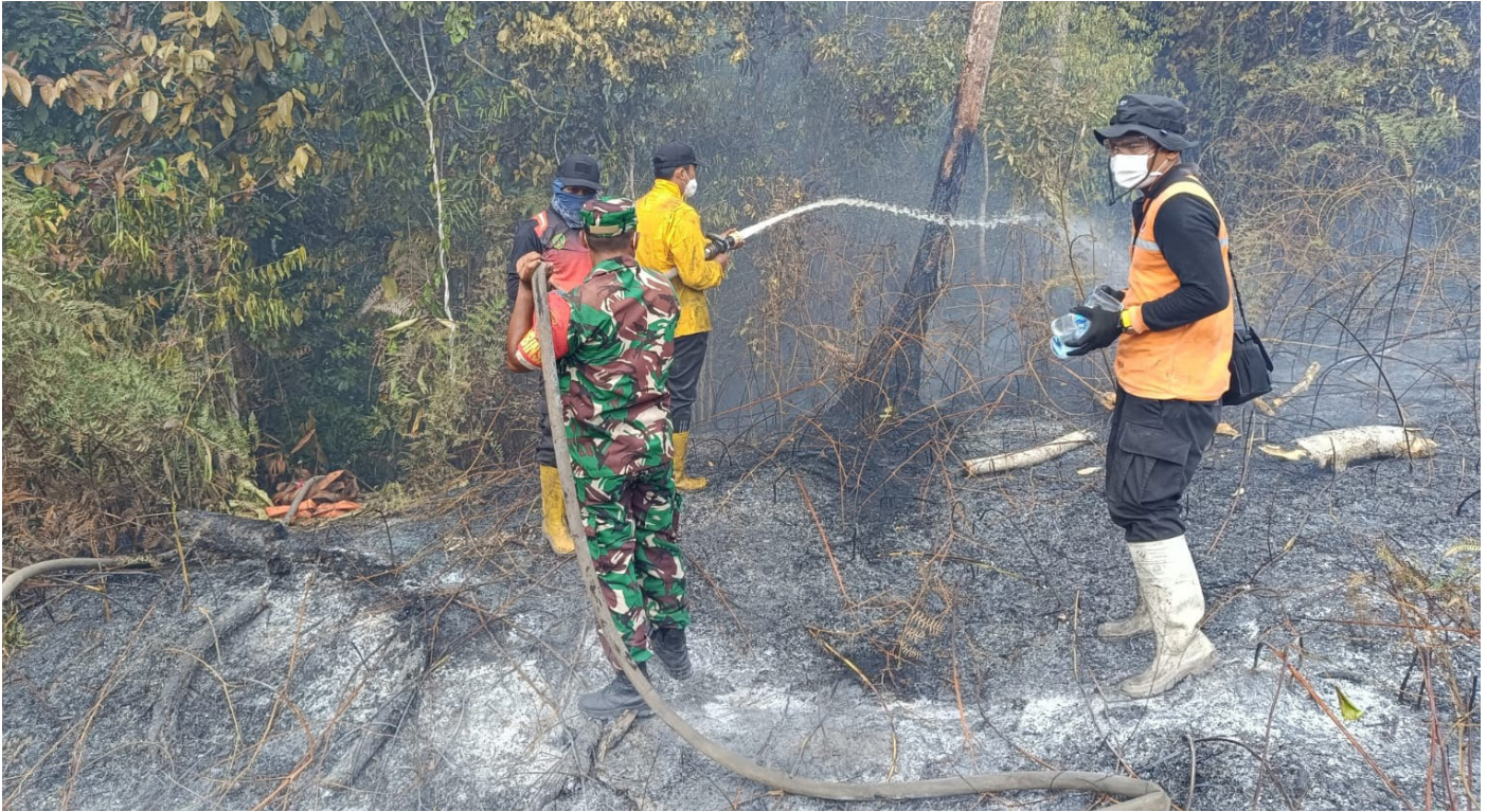
Pemadaman karhutla di Kelurahan Gunung Seteleng, Jumat (8/9/2023).