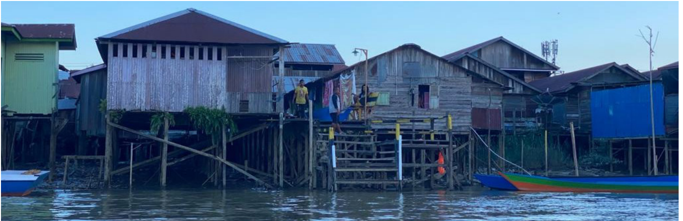
Kondisi belakang rumah pemukiman kumuh di bantaran Sungai Kelay Kelurahan Bugis Kecamatan Tanjung Redeb.