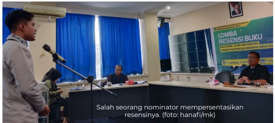
Salah seorang nominator mempersentasikan resensinya.

SAMARINDA – Sebanyak 6 orang dari 65 peserta Lomba Resensi Buku Tingkat Provinsi Kaltim berhasil masuk nominasi. Lomba ini diperuntukkan bagi siswa SMA/SMK/MA negeri dan swasta se-Kaltim.